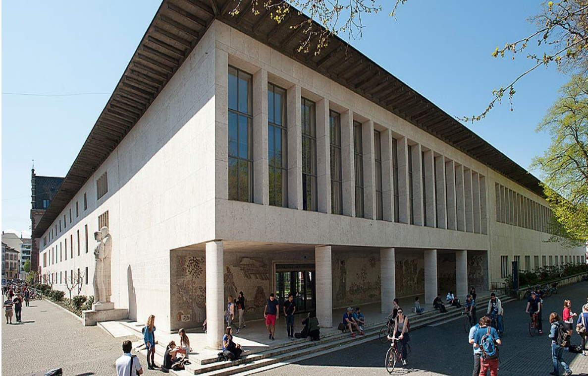
Kollegiengebäude Universität Basel

Eine Kooperation der Universität Basel und der Fachhochschule Nordwestschweiz FHNW