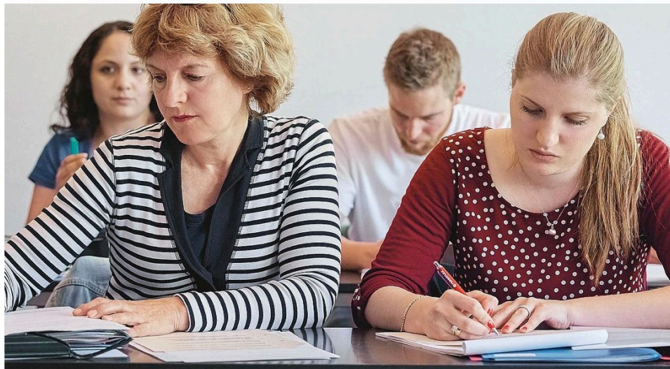
Studieren am Institut für Bildungswissenschaften