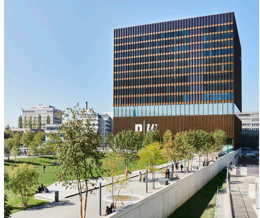
Campus FHNW Muttenz